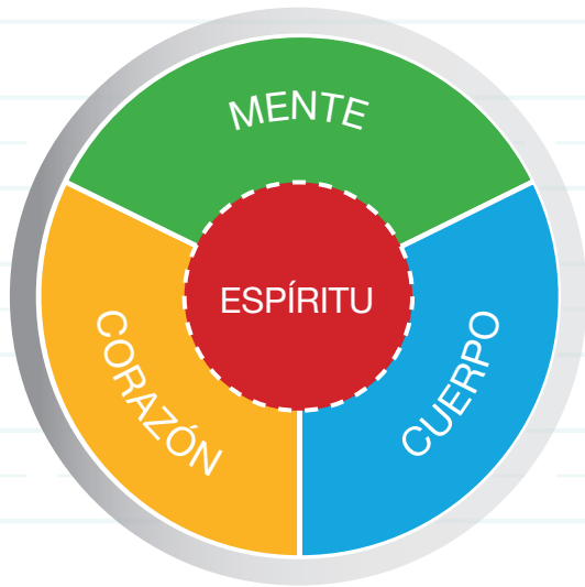
PARADIGMA DE LA PERSONA INTEGRAL

Durante el taller de dos días de Academia para directores de El líder en mí , se presentarán a los participantes el Paradigma de la Persona Integral—un fundamento del liderazgo efectivo—y los 4 Roles de los líderes efectivos™: modelaje, despejar caminos, alineación y facultamiento. Evaluarán sus propias fortalezas y áreas de mejora. Los participantes aprenderán a usar y aplicar poderosas herramientas de liderazgo, como las 4 Disciplinas de la ejecución®, para abordar problemas crónicos que enfrentan en sus escuelas, con tiempo para cubrir un marco de referencia a fin de implementar estas habilidades de liderazgo al regresar a sus escuelas.